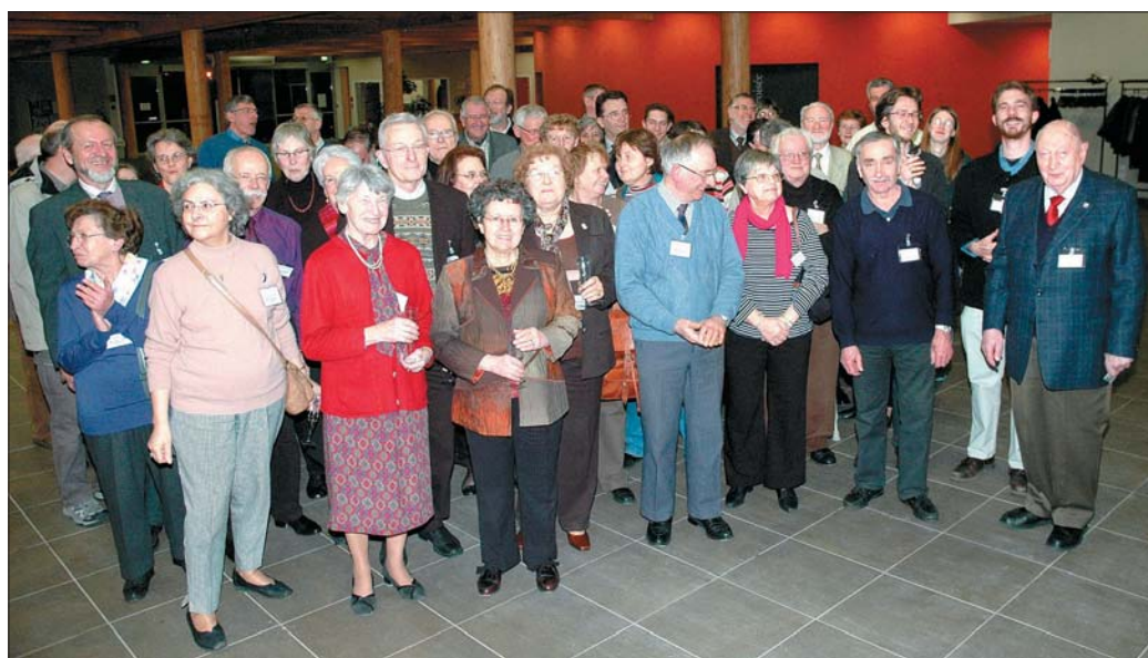
■ La soirée a rassemblé une cinquantaine de convives.

« C'est au jour le jour, avec un noyau de fidèles, que la bibliothèque enrichit son fonds documentaire. Tout provient de dons. Nous acceptons tous les ouvrages. Chaque semaine, nous réceptionnons des cartons entiers de livres. » A ce jour, sur 5 km de rayonnage, 150.000 volumes, plus de 100 revues, plus de 1.200 CDroms, DVD et BD constituent une fabuleuse réserve documentaire qui renferme un fonds ancien de plus de 30.000 volumes, ma-