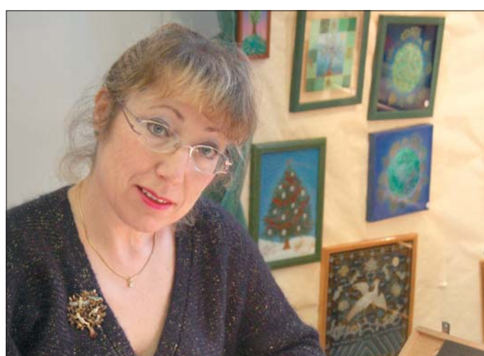
■ L'artiste privilégie les thèmes naïfs et folkloriques.

C'est encore possible aujourd'hui et demain à l'office de tourisme de Nancy.