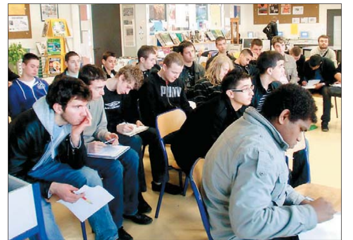
■ Les élèves devront faire leur choix avant le 30 avril.